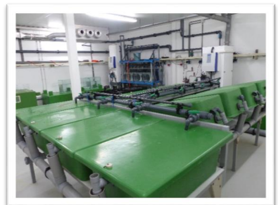
Dit systeem voor de mannetjesdieren is verplaatst

Omdat er de afgelopen tijd steeds meer eitjes en larven geproduceerd worden is hier meer ruimte voor nodig. Daarom zijn we de afgelopen tijd bezig geweest met het verplaatsen en herindelen van verschillende kweeksystemen. De mannetjesdieren zwommen eerst in dezelfde ruimte als de eitjes en de larven. Wij hebben de mannetjes verplaatst, zij zijn nu in één ruimte geplaatst met de vrouwtjesdieren. Hierdoor is er veel ruimte vrijgekomen voor meer larventanks en een plek voor het waterreservoir met zeer schoon water. Dit zeer schone water is nodig om de eitjes en larven beter in leven te kunnen houden, goede waterkwaliteit is hiervoor essentieel.